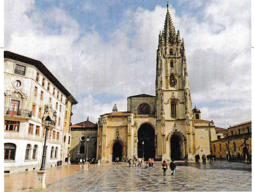
Plaza de Alfonso II, Oviedo.